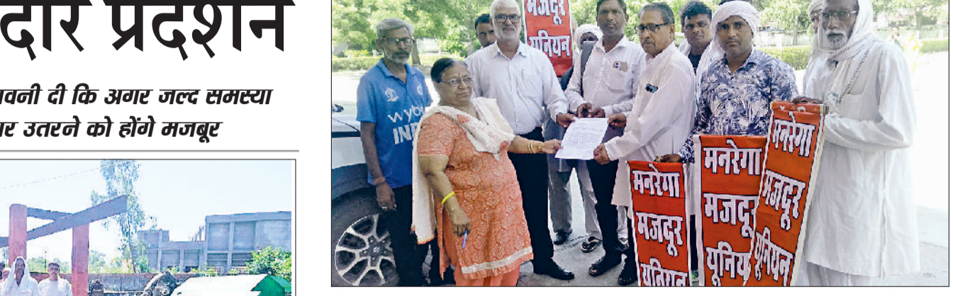
तोशाम। मांगों को लेकर ज्ञापन सौंपते हुए।