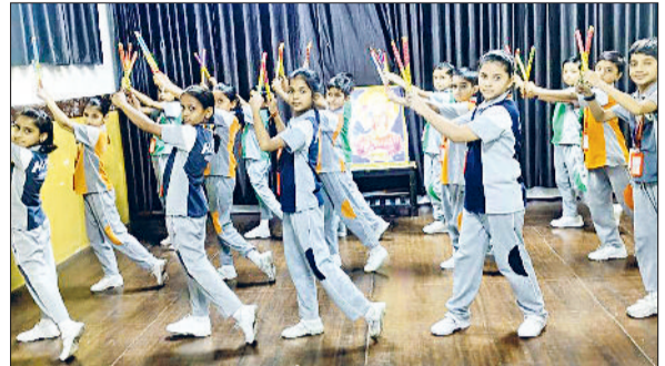
नारनौल। कार्यक्रम की तैयारी करती छात्राएं।

महेन्द्रगढ़। गणेशी लाल महिला महाविद्यालय कनीना के कॉमर्स(वाणिज्य) विभाग के छात्रों ने पारले-जी कंपनी नीमराणा का शैक्षणिक दौरा किया। इस दौरे का उद्देश्य छात्रों को उद्योग के व्यावहारिक पक्ष से अवगत कराना था। छात्रों ने फैक्ट्री के विभिन्न सेक्शन(विभाग) जैसे निर्माण प्रक्रिया, पैकेजिंग, स्टोरेज और गुणवत्ता नियंत्रण आदि को नजदीक से देखा और सीखा कि किस प्रकार एक बड़ी कंपनी अपने उत्पाद का उत्पादन और वितरण करती है। फैक्ट्री में मौजूद अधिकारियों ने छात्रों को पूरी प्रक्रिया की जानकारी दी और उनके सवाल का उत्तर भी दिया। इस भ्रमण में कॉमर्स वाणिज्य विभाग के शिक्षक छात्रों के साथ उपस्थित थे और उन्होंने पूरे कार्यक्रम का मार्गदर्शन किया। यह अनुभव छात्रों के लिए ज्ञानवर्धक और प्रेरणादायक रहा।