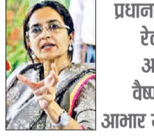
प्रधानमंत्री व रेल मंत्री अश्विनी वैष्णव का आभार जताया

राज्य सभा सांसद किरण चौधरी ने कहा है कि प्रधानमंत्री नरेन्द्र मोदी 25 सितंबर को ऑनलाइन माध्यम से राजस्थान के बांसवाड़ा से वंदे भारत एक्सप्रेस रेल का शुभारंभ करेंगे। यह अत्याधुनिक सुविधाओं से सुसज्जित उच्च गति की रेल बिकानेर से दिल्ली कैंट के बीच संचालित होगी। प्रधानमंत्री श्री मोदी और केंद्रीय रेल मंत्री अश्विनी वैष्णव ने इस ट्रेन के लोहारू और महेन्द्रगढ़ में ठहराव के लिए मंजूरी प्रदान कर दी है, जिसके लिए ए व उनके बहुत-बहुत आभारी हैं। वंदे भारत ट्रेन लोहारू और महेन्द्रगढ़ क्षेत्र के लिए बड़ी