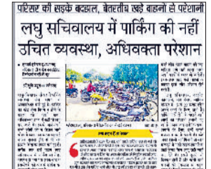
महेंद्रगढ़। 23 सितंबर को प्रकाशित समाचार।

उपमंडल स्थित लघु सचिवालय परिसर में जलपान की सुविधा, फोटो स्टेट तथा सुव्यवस्थित ढंग से पार्किंग का पार्किंग सुनिश्चित करने के मद्देनजर कैंटीन व वाहन पार्किंग के लिए खुली नीलामी का आयोजन तीन अक्टूबर को होगा। यह खुली नीलामी उपमंडल अधिकारी कार्यालय में सुबह साढ़े 11 बजे उच्चतम बोली पर छोड़ा जाएगा। लघुसचिवालय परिसर में करीब एक वर्ष पहले वाहन पार्किंग का टेंडर समाप्त हो गया था। जिसके चलते लघु सचिवालय में आने वाले लोग अपने वाहन को इधर-उधर खड़े कर देते थे। जिसके चलते लोगों को परेशानी उठानी पड़ रही थी। इस समस्या को हरिभूमि अखबार ने 23 सितंबर के अंक में लघु सचिवालय में पार्किंग की नहीं उचित व्यवस्था के साथ प्रमुखता के साथ उठाया था। अब जिला रेडक्रॉस सोसायटी द्वारा उपमंडल कार्यालय में तीन अक्टूबर को खुली बोली लगाने जा रहा है।