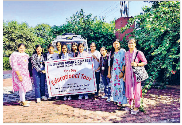
महेन्द्रगढ़। शैक्षिक भ्रमण करते विद्यार्थी।

समाज के आईने में झांकने का इसे बेस्ट शॉर्ट फिल्म का राष्ट्रीय अनुभव कराती है। यही वजह है कि सम्मान दिया गया।