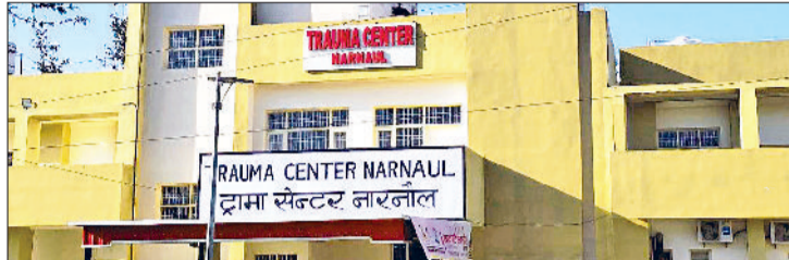
नारनौल। ट्रामा सेंटर भवन।

ट्रामा सेंटर का शुभारंभ 27 दिसम्बर 2024 को मुख्यमंत्री नायब सिंह सैनी के हाथों करवाने का प्रयासन ने प्लान बनाया था। ऐन वकत पर एक दिन पहले 26 दिसम्बर को पूर्व प्रधानमंत्री मनमोहन सिंह का निधन हो गया। इस वजह से आठे अघूरी तैयारियों के बीच ट्रामा सेंटर का शुभारंभ नहीं हो सका। उसके दो माह बाद मार्च माह में इस ट्रामा सेंटर भवन को पीडब्ल्यू एंड बीएडआर विभाग ने स्वास्थ्य विभाग को हेंडओवर किया। फिर स्टफ नियुक्ति को लेकर अप्पूल नहीं मिली है, बावजूद स्वास्थ्य विभाग आचार संहिता हटने के बाद इस ट्रामा सेंटर भवन का शुभारंभ मुख्यमंत्री नायब सिंह सैनी से करवाने में जुट गया। इसके बाद फिर से ट्रामा सेंटर भवन का उद्घाटन करने की फाइल चली। चर्चा चली कि स्वास्थ्य मंत्री आरती सिंह राव के हाथों इसका उद्घाटन हो जाए।