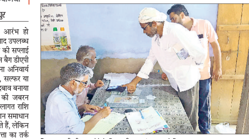
निजामपुर। डीएपी खाद लेने के लिए मशीन पर अगुआ लगाते किसान।

चिंतित किसान समाधान के लिए इधर-उधर चक्कर भी लगाते हैं, लेकिन उच्चाधिकारी भी उत्पादों की गुणवत्ता का तर्क देकर किसानों को चुप कराने में जुटे हुए हैं। किसानों को जिंक, सल्फर या टीएसपी खाद साथ में खरीदने का दबाव बनाया जा रहा है